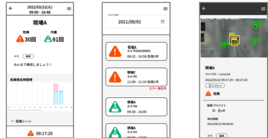
作業の記録・管理画面

ブラウザで閲覧する専用のアプリケーションを使い、現場ごとの危険シーン等をピンポイントで確認できます。シーンやその日の現場に対してメモをしたり、動画のダウンロードも行えます。